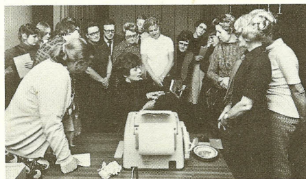
En instruktør fra Post- og Telegrafvæsenet underviser i foredragssalen på Industrigården en del af de kommende brugere af telexinstallationen.

Al telexforbindelse til Philips-selskaberne på Amager er hidtil sket via telexinstallationen i Jenagade. Nu oprettes tillige to telexforbindelser på Industrigården. Den ene er placeret i Philips Lampe og betjener alene dette selskab. Den anden findes i postafdelingen på tredje sal og betjener alle øvrige selskaber. I tilknytning til denne er der placeret satellitstationer i form af perforeringsmaskiner i Dansk Røntgen-Teknik, i Salgsafdeling Industri, i Servicecentret og i sekretariatene på fjerde sal i nordfløjen. På disse maskiner kan man skrive sin meddelelse, som man får udskrift af i klar skrift og i hulstrimmel. Hulstrimlen afleveres til postafdelingen, som blot drejer den ønskede abonnent, hvor på strimlen stikkes ind i maskinen.