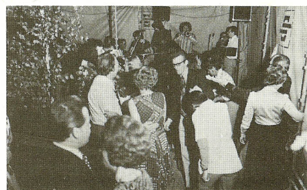
PCL-medarbejderne danser på terrassen i Glostrup ved foreningens sommerfest.