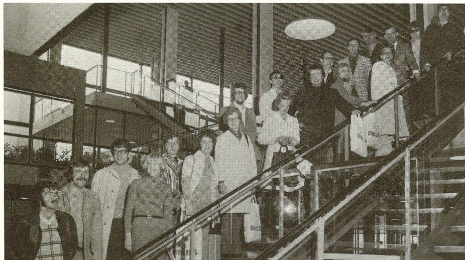
Deltagerne i Philips Sportsstævne i Kastrup Lufthavn forud for afrejsen til Helsingfors.

Sverige var bedste nation ved de nordiske Philips-mesterskaber, der blev afviklet i Finland i maj måned