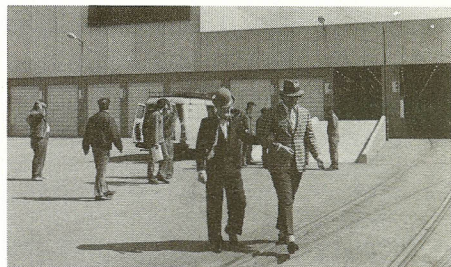
Ove Sprogøe og Morten Grunwald foran „Multi Scan“ under en prøve forud for filmoftagelsen til den næste film i serien om „Olsen-Banden“.

Der var 180 deltagere i generalforsamlingen, hvor man indgående drøftede beskæftigelsessituationen.